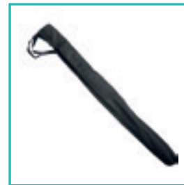
Sac de transport