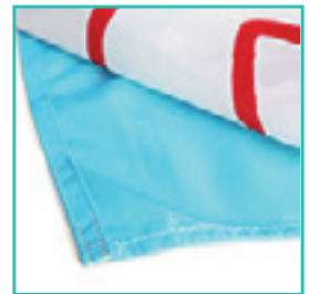
Tissu polyester ou bache PVC