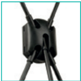
Structure monobloc déployable pour une utilisation rapide