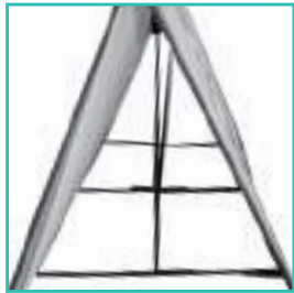
Montage des barres de renfort par velcro