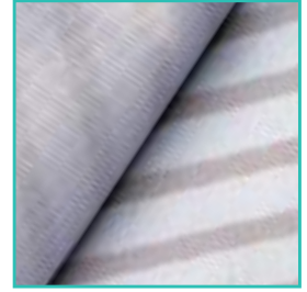
Tissu polyester 200 g/m 2 avec impression par sublimation