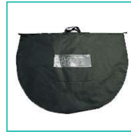
Sac de rangement pour le transporter facilement