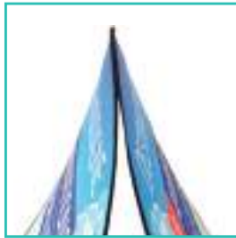
Impression recto / verso pour une meilleure visibilité