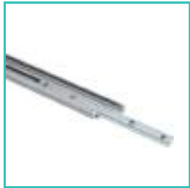
Segments de 2 m emboîtables pour une utilisation nomade avec sac à roulettes