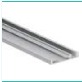
Structure de 1,5 cm d'épaisseur en aluminium anodisé