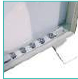
Possibilité de rétro éclairer le cadre avec des modules LED