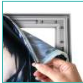
Visuel interchangeable facilement grâce à son joint en silicone